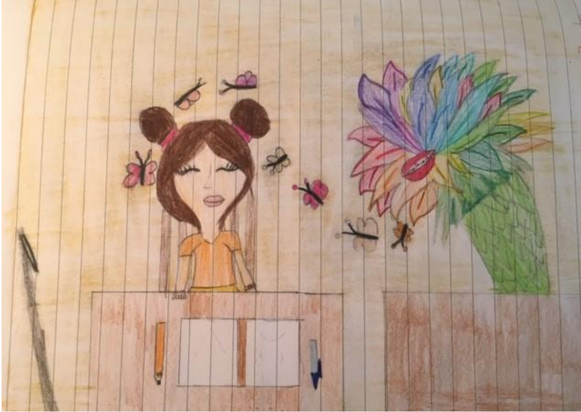
Disegno ispirato al libro "Lucia" di Roger Olmos

Oggi i maestri ci hanno portato in giardino bendati come se fossimo ciechi, perché volevamo sapere cosa si provava a conoscere la realtà senza poterla vedere. Noi tempo fa abbiamo anche letto la storia di Lucia, una bambina non vedente, e per questo siamo andati fuori bendati. Gli alberi che ho toccato erano ruvidi, le foglie dell'edera erano lisce e la terra dell'orto era un po' soffice. È stato molto bello, emozionante e divertente, e credo che sia stato molto divertente anche per i miei compagni. È stata anche una grande esperienza per me e per i miei compagni. V.Z