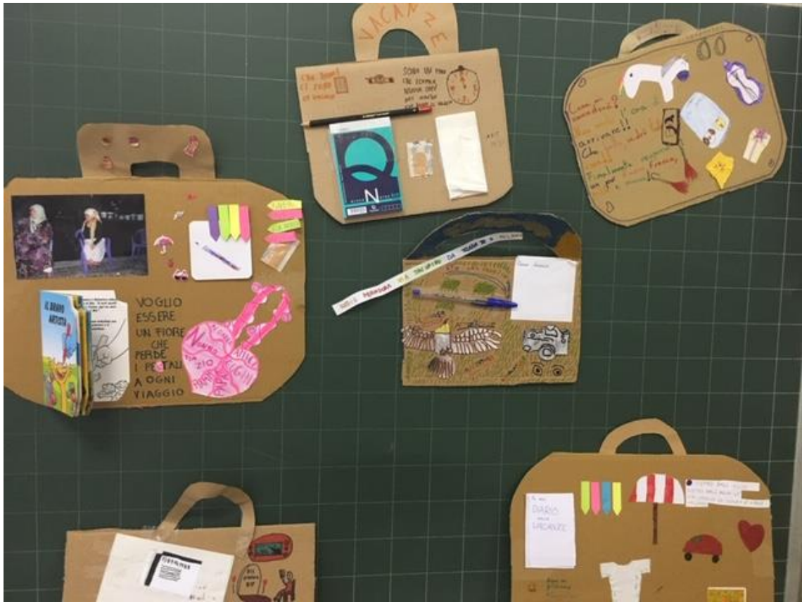
Valige costruite dai bambini prima dello scritto sul viaggio

L'estate scorsa dovevo andare in Ecuador ed ero molto eccitata all'idea di poter visitare la mia famiglia. Sono salita sull'aereo a Milano con l'hostess e altri bambini per fare scalo ad Amsterdam. Qui ci siamo fermati per prendere l'altro aereo che ci portava a Barcellona, Quito e dopo in Guayaquil, la città dove vive la mia famiglia.