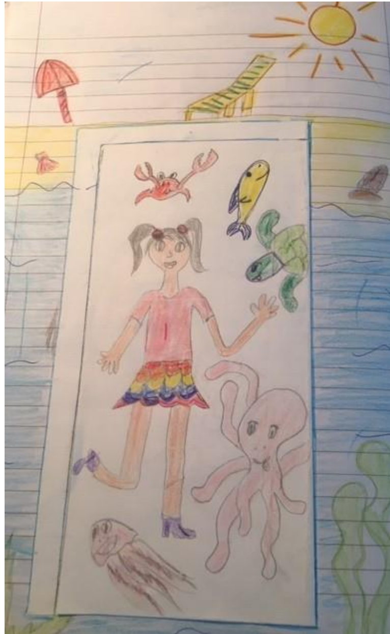
Costruzione con la carta di una porta immaginaria